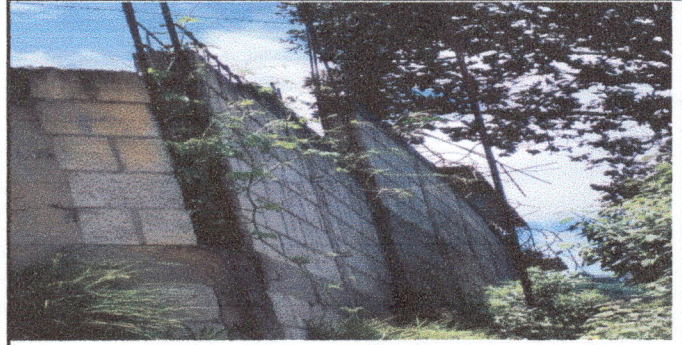
Foto 6: se colocará sobre la pared malla galvanizada, para el resguardo y seguridad de las instalaciones de la Escuela. Esta pared es continuación de donde se desarrollará el remozamiento.

Observación: Si es necesario se pueden agregar hojas adicionales y especificar el número de hojas.