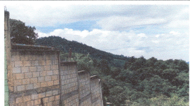
Foto 5: Cuando ya este construida la nueva pared, se colocará sobre la pared malla galvanizada, para el resguardo y seguridad de las instalaciones de la Escuela.