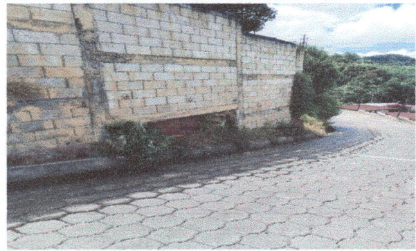
Foto 4: Vista en la segunda parte externa de la pared, se observa también perdida en la parte baja de la pared, foto 3 y 4 representa peligro para la comunidad educativa y posible colapso del total de la pared.