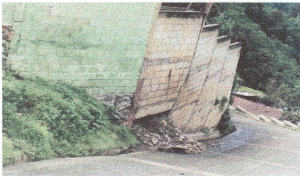
Foto 3: Vista en la primera parte externa de la pared, se observa humedad, perdida de la pared en la parte baja de la pared.