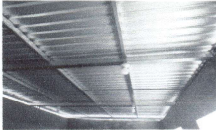
Foto1: Reglón No.1 Cubierta de lámina, cambio de techo para la cocina