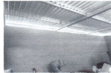
Foto 4: Reglón No. 10 Reparación de repello y cernido de paredes de cocina