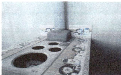
Foto 5: Reglón No. 6 reparación o sustitución de área de cocina, estufa rural