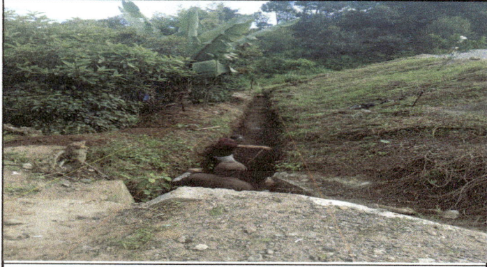
ORILLA DEL TERRENO PARTE DE ENFRETE