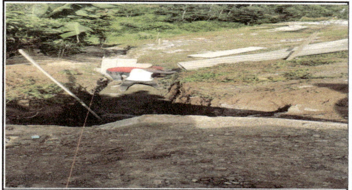
ORILLA DE TERRENO PARTE DE ENFRETE