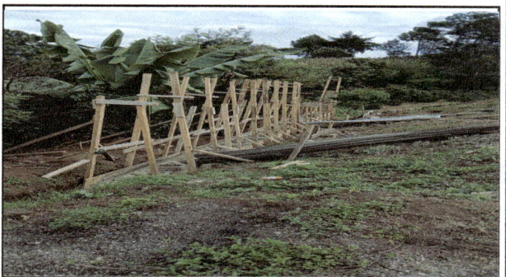
ORILLA DE LA PARTE BAJA DEL TERRENO