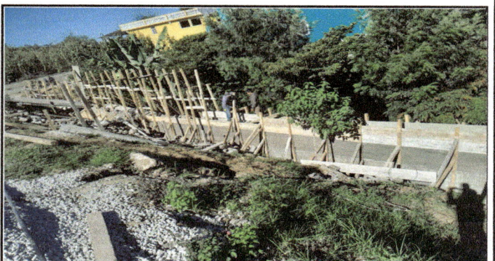
ORILLA DEL TERRENO PARTE MEDIA

Observación: Si es necesario se pueden agregar hojas adicionales y actualizar el número de hojas.