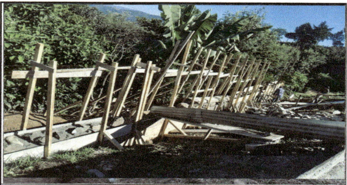
ORILLA DE LA PARTE BAJA DEL TERRENO