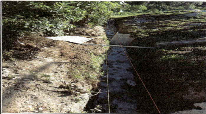
BAJADA DE LA ORILLA DEL TERRENO