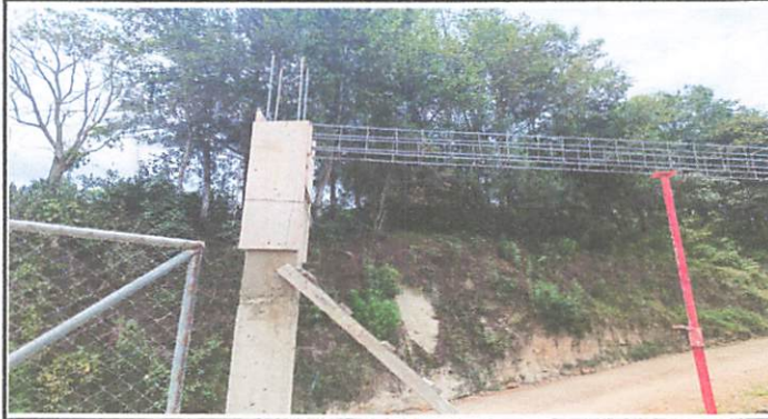
Foto1: Construcción de muros para colocación de portón de entrada.