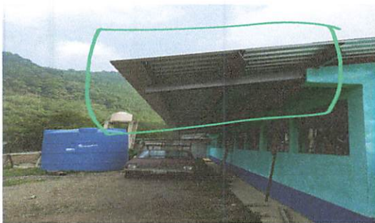
Foto No. 5 instalacion de sombre de 20 metros de largo por 2 metros de ancho

Observación: Si es necesario se pueden agregar hojas adicionales y actualizar el número de hojas.