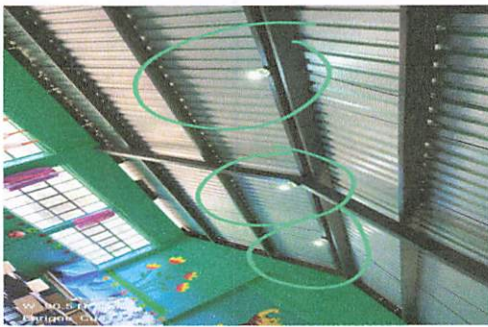
FOTO No. 3 Cambio de focos en los salones