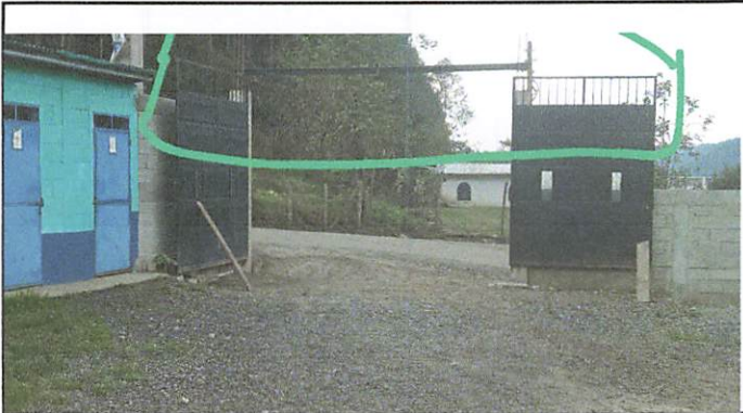
Foto1: , POSTERIOR ARREGLO DEL PORTON