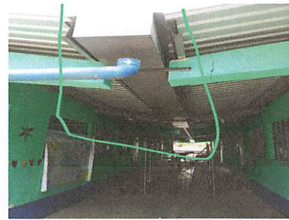
FOTO No. 4 Cambio de canales en 26 metros del corredor