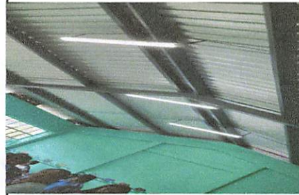
Foto No. 4, cambio de candelas por bombillas para mejorar la luz en las aulas