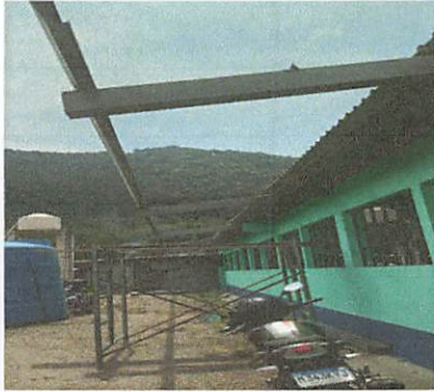
FOTO No. 1 Momento en que se inicia a trabajar la sombra