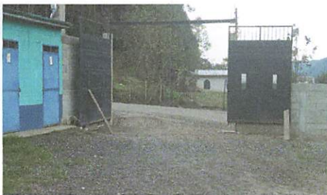
Foto No. 5, se eleva el porto 25 cms. Para que no filtre agua en su Estado respectivo, que no tenga oxido

Observación: Si es necesario se pueden agregar hojas adicionales y actualizar el contenido de las mismas.