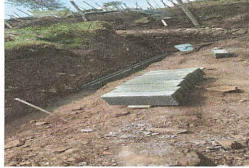
Fot No. 2 se inicia el trabajo del muro perimetral