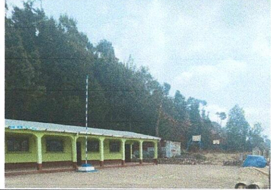
FOTO: 1 TECHADO DE PILA Y CORREDOR