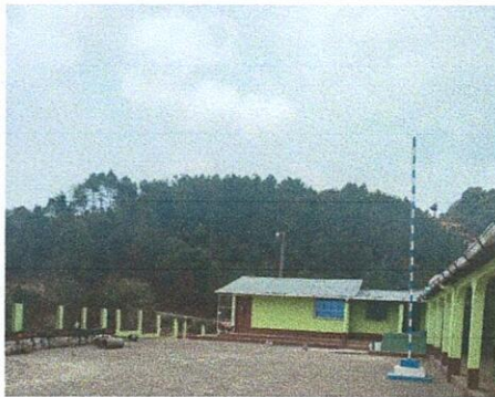
FOTO: 1 TECHADO DE PILA Y CORREDOR