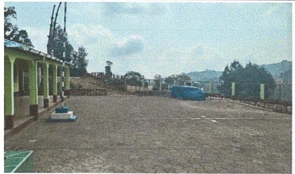
FOTO: 1 TECHADO DE PILA Y CORREDOR