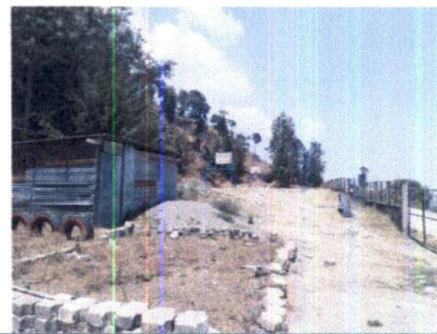
Foto 12: AREA LATERAL DONDE SE REALIZARA EL MEJORAMIENTO DE MURO PERIMETRAL