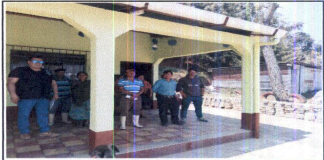
Foto 8: EVALUADOR DE CAMPO EN LA INSTALACIONES DE MÓDULO DE AULAS