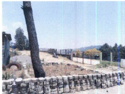
Foto 9: VISTA LATERAL DONDE SE MEJORARA EL MURO CON DOS HILADAS DE BLOCK