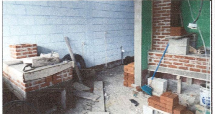
Instalación de 2 poyos con plancha y chimenea de ladrillo.