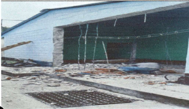
Ampliación de cocina hacia lado izquierdo.