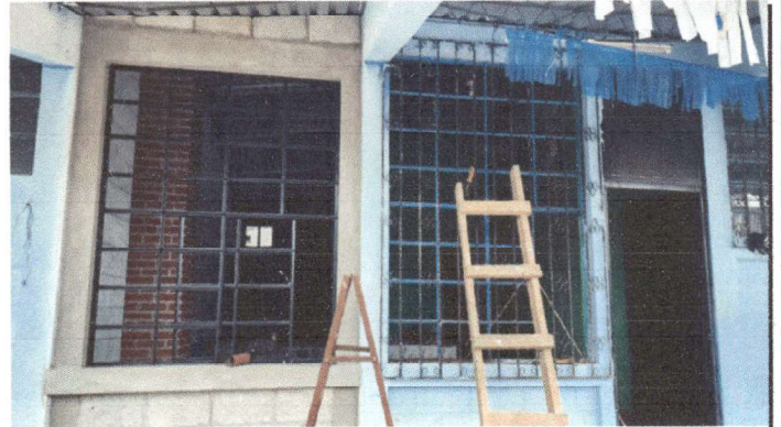
Ventanas y Balcones de metal