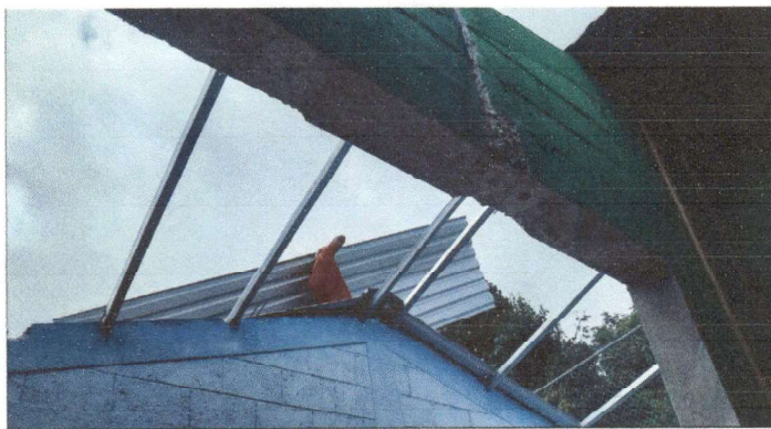
Techo de estructura.