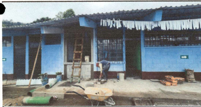
Piso cerámico antideslizante