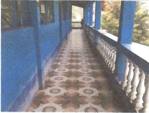
Foto 1: Establecimiento No. 1 colocación de piso en pasillo de modulo 1, 2, 3 y 4