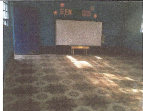
Foto 2: Colocación de piso cerámico en biblioteca, aula, modulo 1, 2, 3 y 4