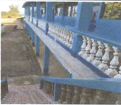
Foto3: Establecimiento No. 1 Remodelación de voladizo