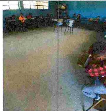
Foto 2: Colocación de piso cerámico en biblioteca, aula, modulo 1, 2, 3 y 4