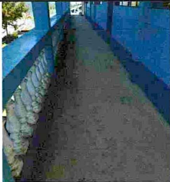
Foto 1: Establecimiento No. 1 colocación de piso en pasillo de modulo 1, 2, 3 y 4