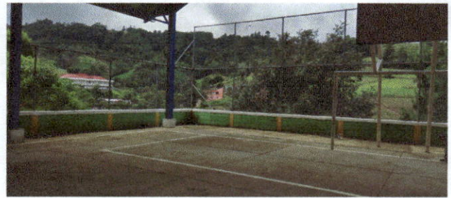
cercos o muro perimetral sustitucion de malla