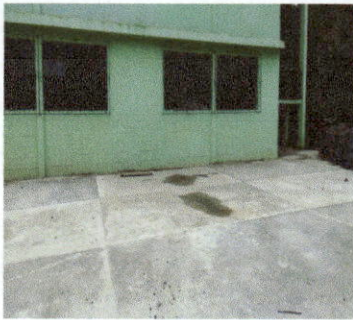
Losa de patio