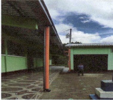
Bajadas de agua pluvial