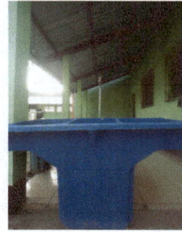
Sustitucion de pila