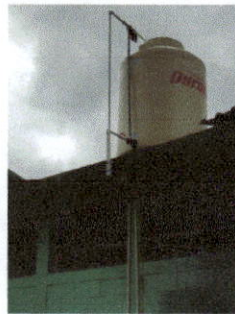
Reparación de red de drenajes y agua potable