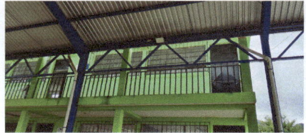
Mantenimiento de barandas