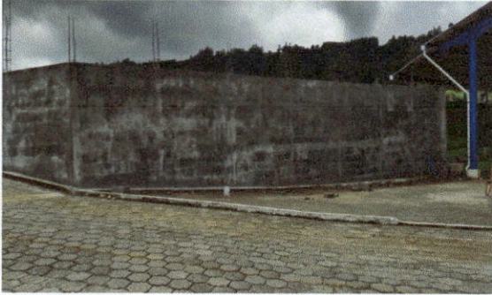
Reparacion de muro de contención