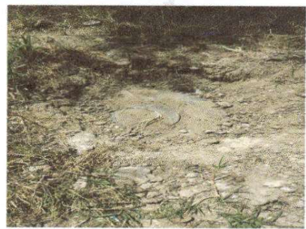
cambio de cisternas de drenajes

Observación: Si es necesario se pueden agregar hojas adicionales y actualizar el número de hojas.