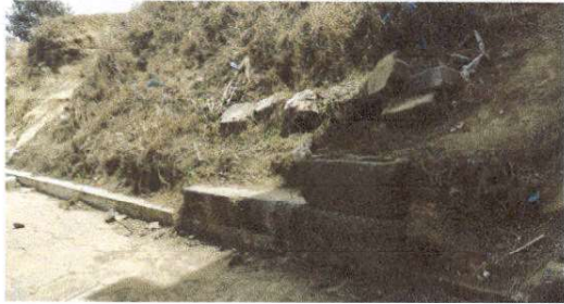
Reparacion de muro de contención