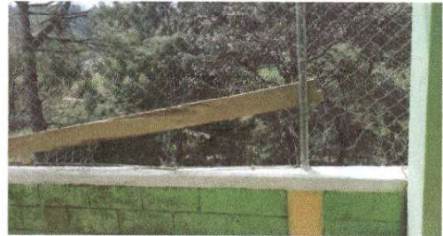
cercos o muros perimetrales sustitución de malla