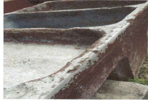
Sustitucion de pila

Observación: Si es necesario se pueden agregar hojas adicionales y actualizar el número de hojas.