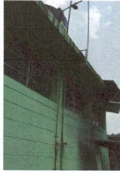
Reparación de red de drenajes y agua potable