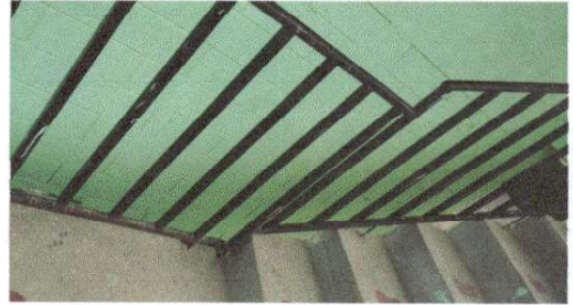
mantenimiento de barandas