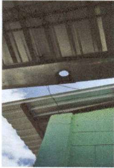
Bajadas de agua pluvial