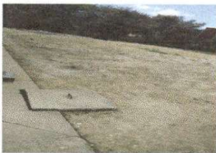
Losa de patio