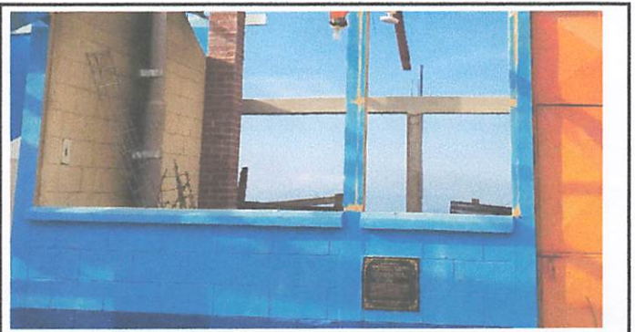
Necesario cambio de vidrios, repintado de marcos y puerta de cocina

Observación: Si es necesario se pueden agregar hojas adicionales y actualizar el número de hojas.