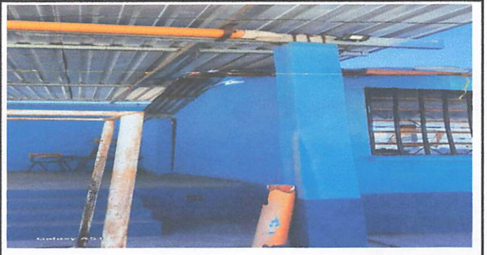
Cambio de bajadas