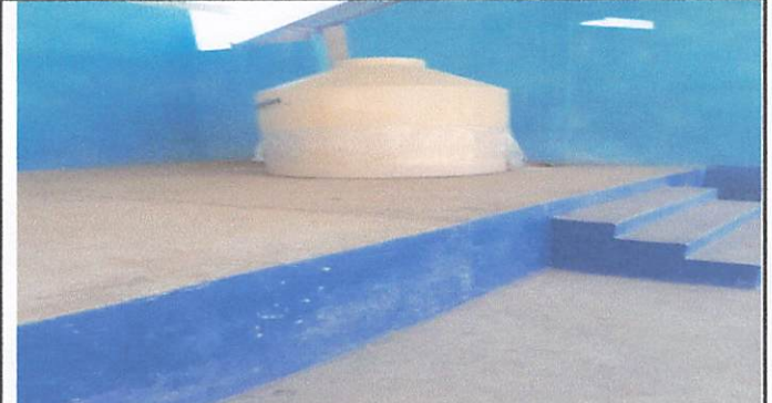
Cambio de deposito de agua para sanitarios