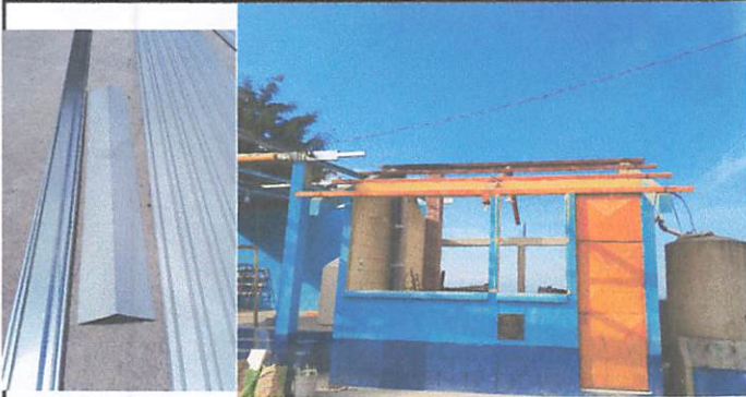
Necesario remozamiento de estructura metálica del techo y cambio de cubierta y cambio de canales