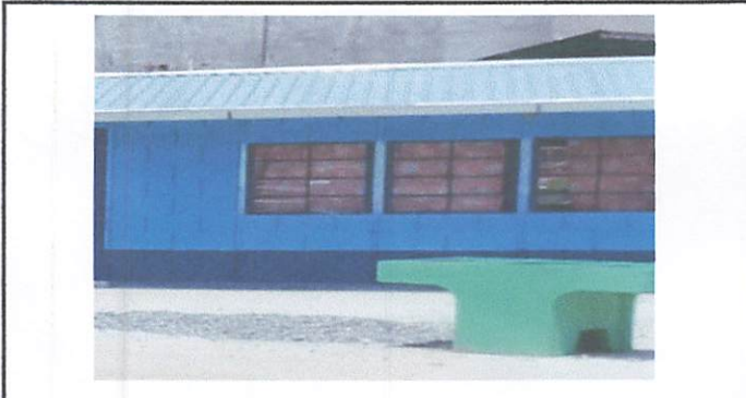
Cambio de pila de concreto de dos alas