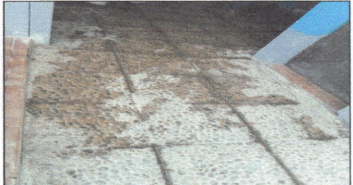
FOTO2: POSTERIOR DE COLOCACION DE PISO CERAMICO DEL CORREDOR DE COCINA Y BAÑOS