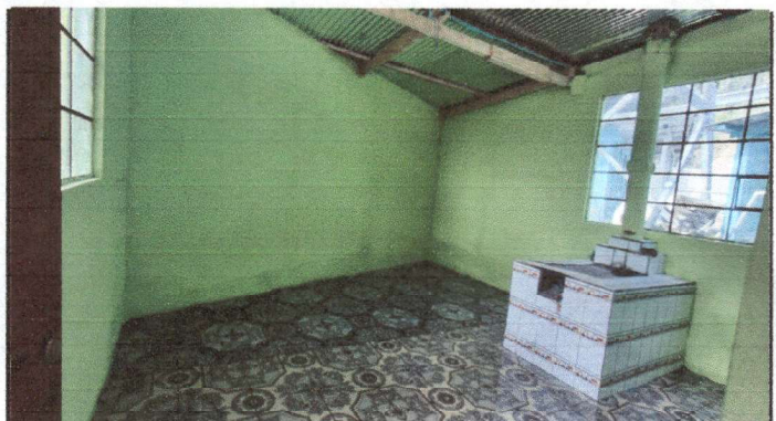
ampliación de cocina