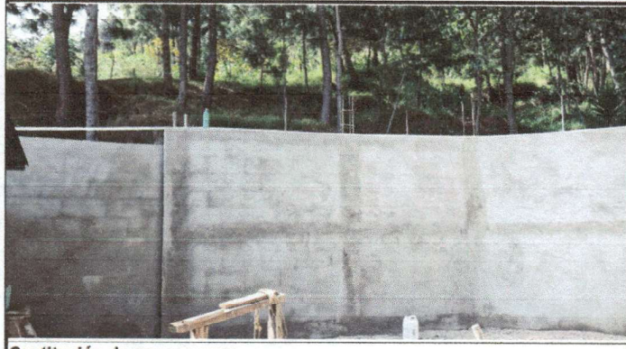
Sustitución de cerco a muro