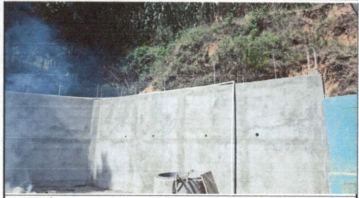
Sustitución de cerco a muro