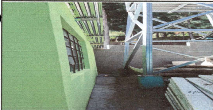
Ampliación de cocina