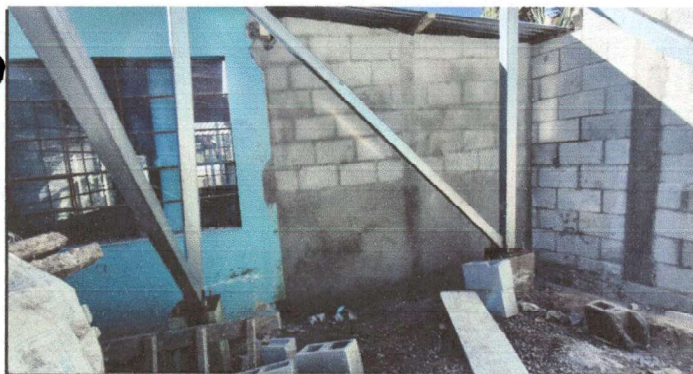
Ampliación de cocina