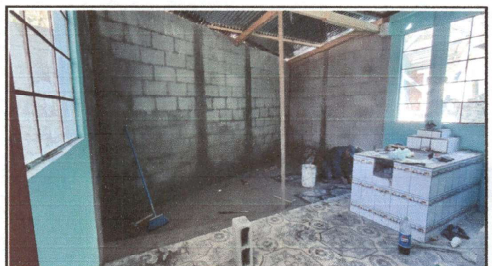
ampliación de cocina