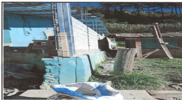
cerco a muro formal