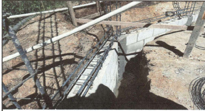
Sustitución de cerco a muro