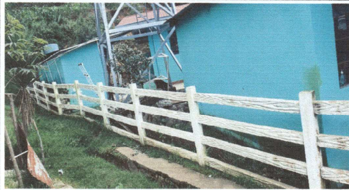
Sustitución de cerco a muro