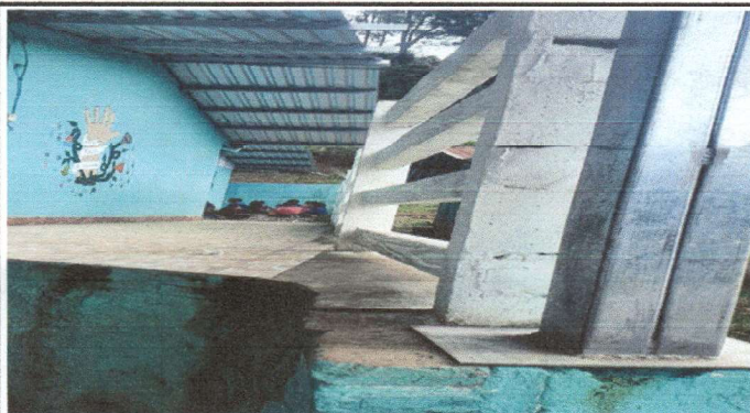
cerco a muro formal