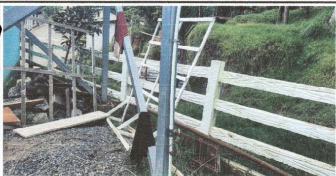
Ampliación de cocina