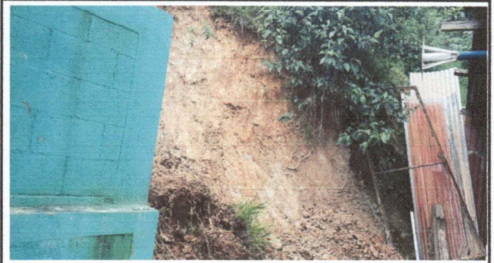
Muro de Contención