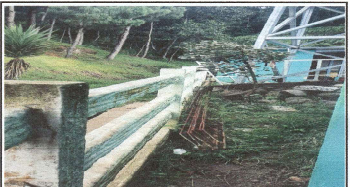
ampliación de cocina