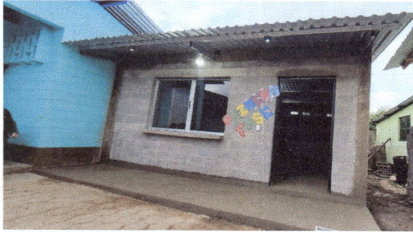
Foto 1: Inauguración de la primera fase de Remozamiento Ampliación de Cocina EOUM 'Rafael Alvarez Ovalle' J.v