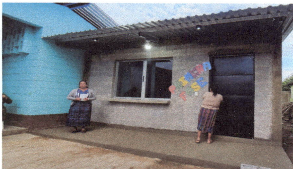
Foto 5: Ingreso a la nueva cocina de la EOUM 'Rafael Alvarez Ovalle' JV