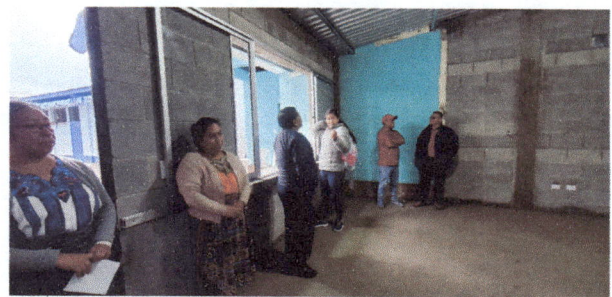
Foto 6: Parte interior de la cocina de la EOUM 'Rafael Alvarez Ovalle'

Observación: Si es necesario se pueden agregar hojas adicionales y actualizar el número de hojas.