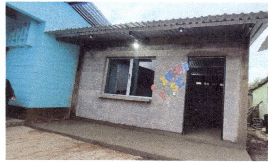
Foto 2: Iluminación, area de despacho de la cocina de la EOUM 'Rafael Alvarez Ovalle' JV