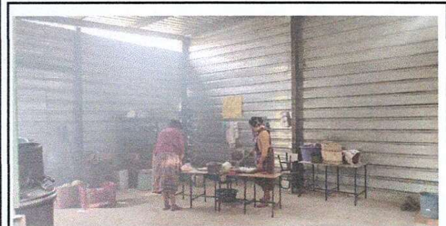
Foto 3: Cocina que se va reconstruir por completo, por deficiencia de ventilación.