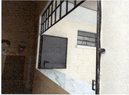
Foto1: Implementar desayunoador