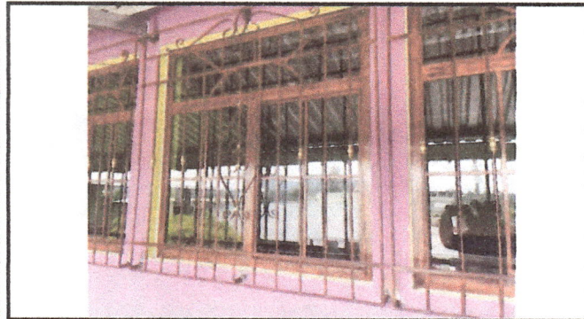
Foto 3: Se colocaron ventanas y balcones a los salones del segundo nivel.