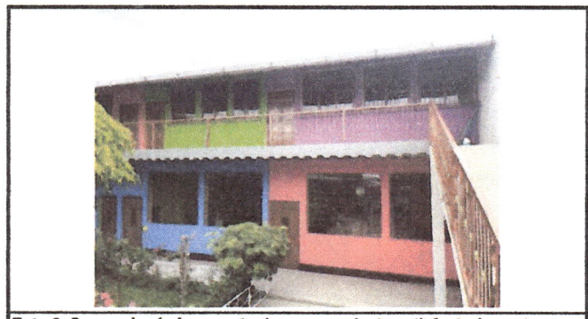
Foto 6: Se concluyó el proyecto de remozamiento satisfactoriamente.

Observación: Si es necesario se pueden agregar hojas adicionales y actualizar el número de hojas.