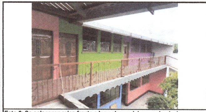
Foto 5: Se colocaron rejas frente a los salones del segundo nivel y se pintaron las paredes.