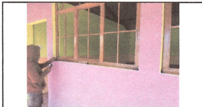
Foto 5: Se colocan puertas, ventanas y balcones a los salones construidos.