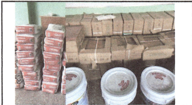
Foto1: Se compró el piso cerámico, pegafuerte, sisa y unas cubetas de pintura.