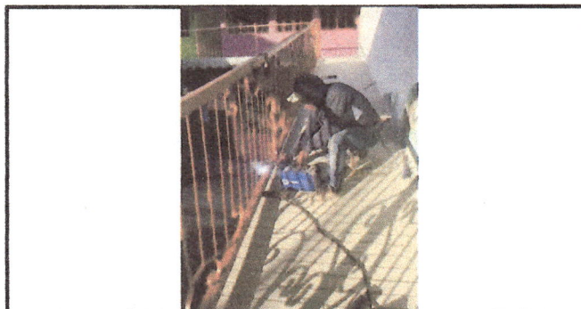
Foto 6: Se colocan rejas y pasamanos en la rampa y al frente de los salones.

Observación: Si es necesario se pueden agregar hojas adicionales y actualizar el número de hojas.