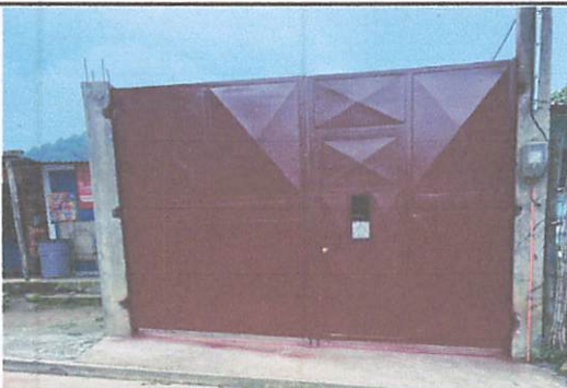
Foto 5: Finalización de fabricación e instalación de porton de entrada principal