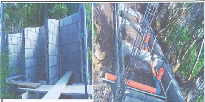
Foto1: Avance de remodelacion de baños