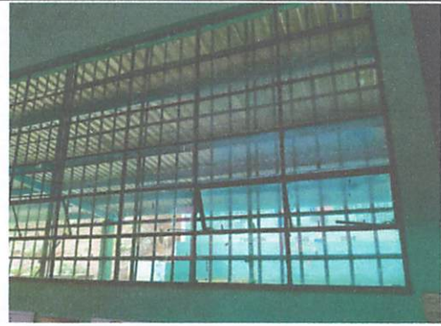
Foto 4. 5.1 Mantenimiento de estructura de metal de ventanas. Ejecutado en un 100%.