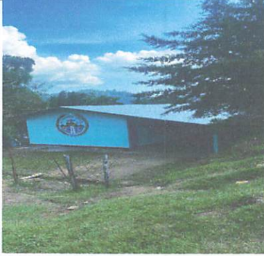
Foto 1. 1.1 Sustitución de lamina Troquelada. 1.2 Sustitución de capotes, para lámina troquelada. 1.3 Sustitución de elementos de fijación Ejecutado en un 100%