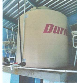
Foto 6: 18.3 sustitución de deposito de agua de 1700 litros ejecutado en un 100%.

Observación: Si es necesario se pueden agregar hojas adicionales al final de las hojas.