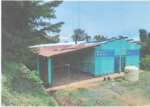
Foto 1. Proceso de sustitución de lamina. Sustitución de capotes, para lámina troquelada. Sustitución de elementos de fijación.