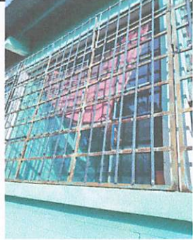
Foto 6. Mantenimiento. Y Reforzamiento de Balcones.

Observación: Si es necesario se pueden agregar hojas adicionales y actualizar el número de hojas.