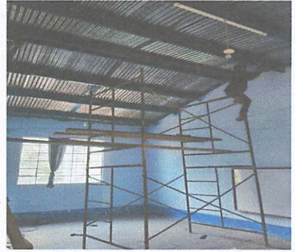
Foto 2. Mantenimiento de estructura de soporte de metal.