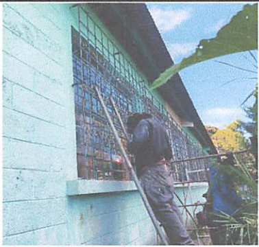
Foto 5. Mantenimiento de estructura de metal de ventanas.