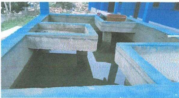
PILA DE 3M DE ANCHO POR 5M DE LARGO