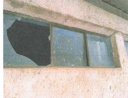
VIDRIOS EN MAL ESTADO DE SANIARIOS