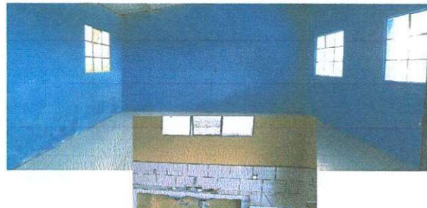
FALTA DE ENERGIA ELECTRICA EN EL AREA DE COCINA, COMEDORES Y SALON