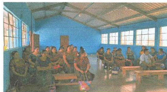
ORGANIZACIÓN Y PLANIFICACION DEL PROYECTO DEROMOZAMIENTO NUFED NO.2 SACALÁ LAS LOMAS

Observación: Si es necesario se pueden agregar hojas adicionales y actualizar el número de hojas.