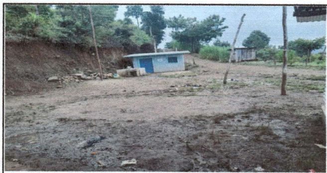
Foto 6: Levantado de paredes de cocina, drenaje, cerámico, instalación eléctrica, pintura.

Observación: Si es necesario se puedan agregar hojas adicionales y actualizar el número de hojas.