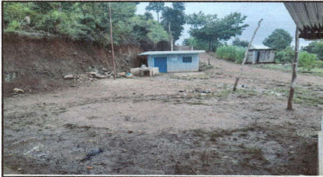
Foto 1: Levantado de paredes de cocina, drenaje, cerámico, instalación eléctrica, pintura.