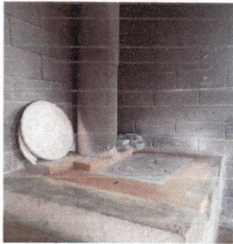
Foto 1: Finalización de los trabajos para el mejoramiento de la estufa rural