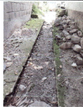
Foto 2: Finalización de los trabajos para el mejoramiento de la tubería de drenaje