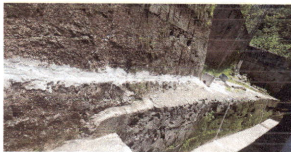
Foto 5: Finalización de la instalación de la tubería de agua que se dirige a los baños de hombres y mujeres