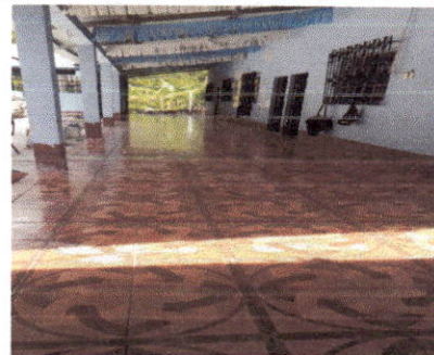
Foto 6: Finalización de la colocación de la cerámica en el corredor y salón del establecimiento.

Observación: Si es necesario se pueden agregar hojas adicionales y actualizar el número de hojas.