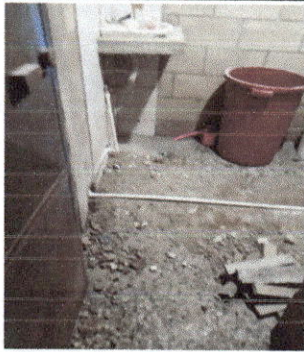
Foto 3: Inicio de la colocación de la tubería en los baños de hombres y mujeres