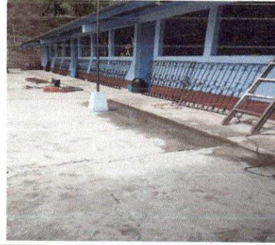
Foto 2: Instalacion de balcones, puerta y ventana en los salones indicados