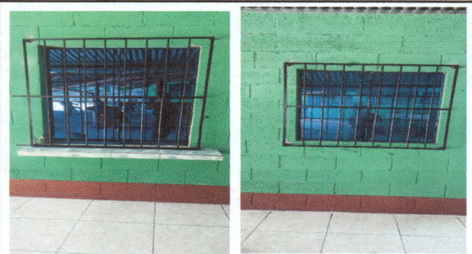
Foto 2: Cambio de 20 pies de vidrio de ventana de cocina. E instalación de 2 m2 de balcón