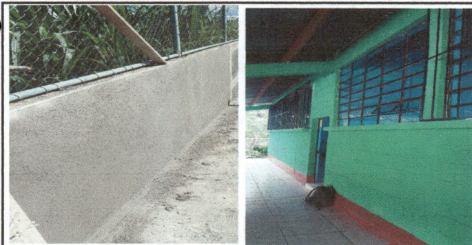
Foto 5: Repello de un muro de circulación de escuela por deterioro de 50 m2. para su protección. Y pintura para 3 salones de clases, 4 sanitarios y cocina.