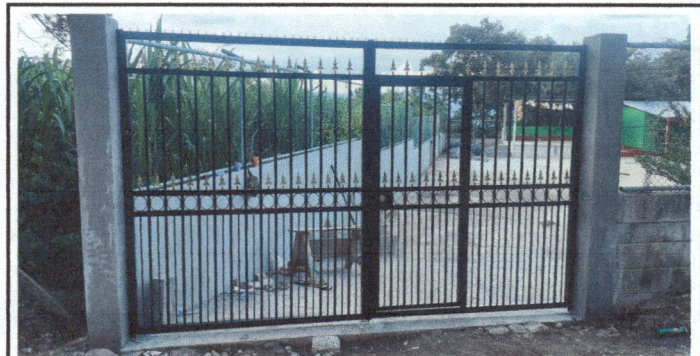
Foto 6: Cambio de portón principal del establecimiento por deterioro, de 4.20 m de ancho por 2.20 m de alto.

Observación: Si es necesario se pueden agregar hojas adicionales y actualizar el número de Hojas.