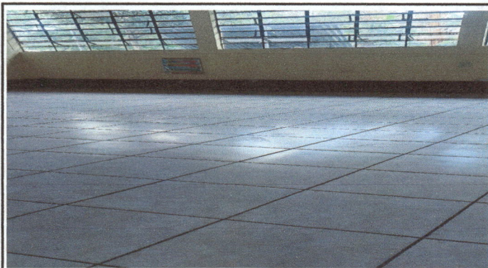
Foto 3: Construcción de 227 m2 de base de concreto de 6 cm para instalación de 227 m2 de piso cerámico en 3 salones de clases y corredor.