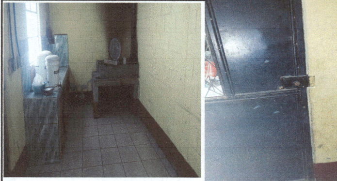
Foto1: Instalación de 36 m2. De piso cerámico en área de cocina y corredor. Cambio de chapa de puerta de cocina por deterioro.