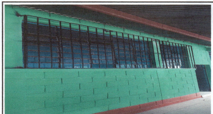
Foto 4: Cambio de 92 piezas de vidrios quebrados de 3 salones de clases, de 1 pie cada uno e instalación de 30 m2 de balcones de 3 salones de clases.