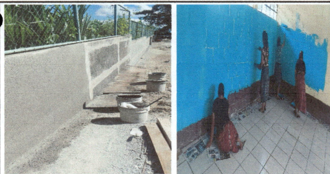
Foto 5: Repello de un muro de circulación de escuela por deterioro de 50 m2. para su protección. Y Pintura para 3 salones de clases, 4 sanitarios y cocina.