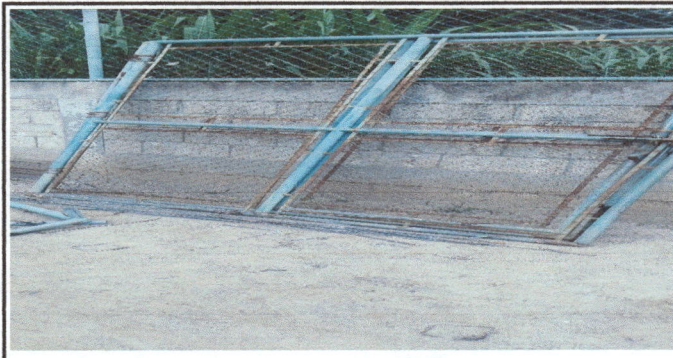
Foto 6: Cambio de portón principal del establecimiento por deterioro, de 4.20 m de ancho por 2.20 m de alto.

Observación: Si es necesario se pueden agregar hojas adicionales y actualizar el número de hojas.