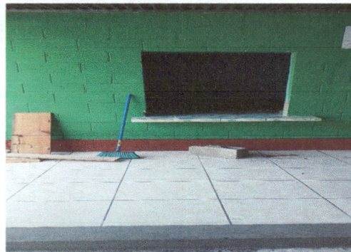
Foto 2: Cambio de 20 pies de vidrio de ventana de cocina. E instalación de 2 m2 de balcón