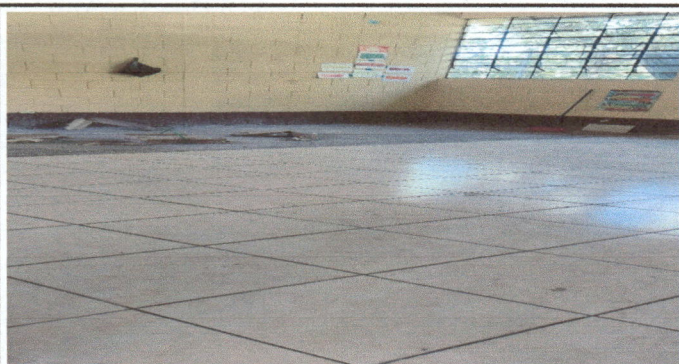
Foto 3: Construcción de 227 m2 de base de concreto de 6 cm para instalación de 227 m2 de piso cerámico en 3 salones de clases y corredor.