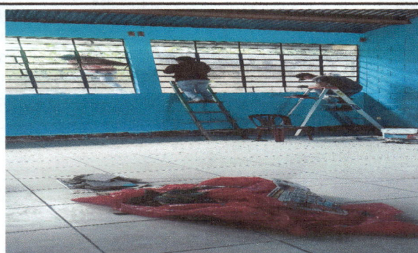
Foto 4: Cambio de 92 piezas de vidrios quebrados de 3 salones de clases, de 1 pie cada uno e instalación de 30 m2 de balcones de 3 salones de clases.