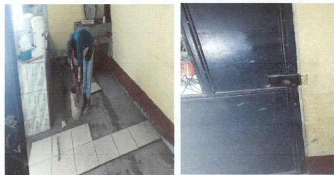
Foto 1: Instalación de 36 m2. De piso cerámico en área de cocina y corredor. Cambio de chapa de puerta de cocina por deterioro