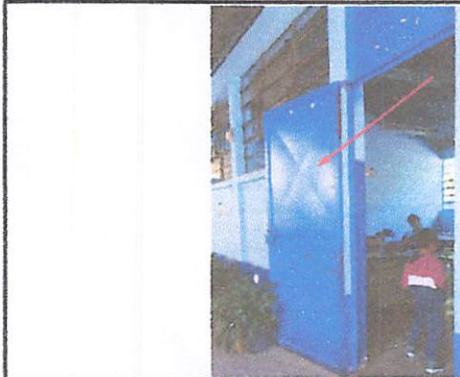
Foto 15: Quitar, cortar de largo e instalar 3 puertas de metal en salones.

Observación: Si es necesario se pueden agregar hojas adicionales y actualizar el número de hojas.