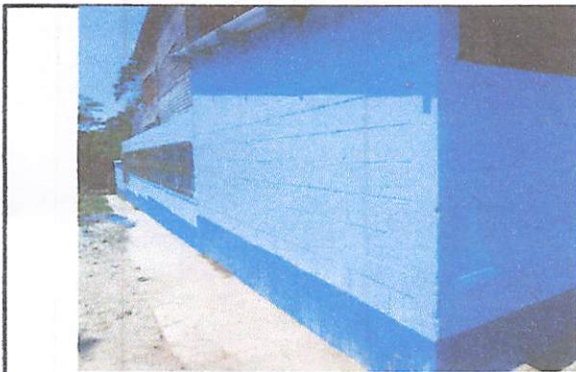
Foto3: Cernido y ensabietado de pared.