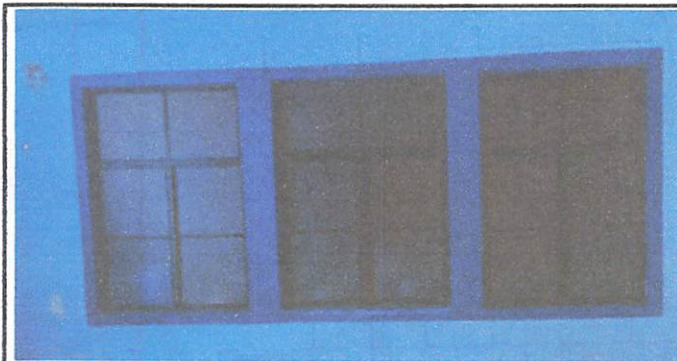
Foto 9: Suministro, fabricación e instalación de balcones de metal corredizos con medidas de 1.60m x 1.13m para seguridad en cocina.