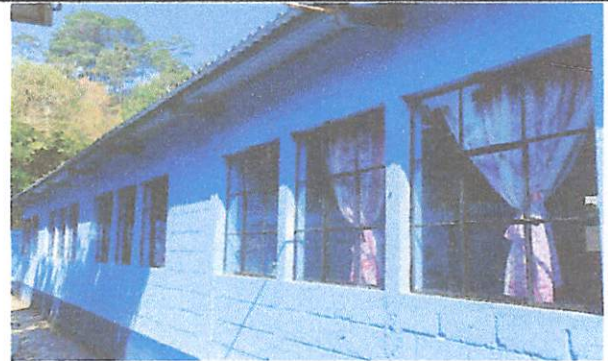
Foto 8: Suministro, fabricación e instalación de balcones de metal con medidas de 1.50m x 1.25m para seguridad en salones