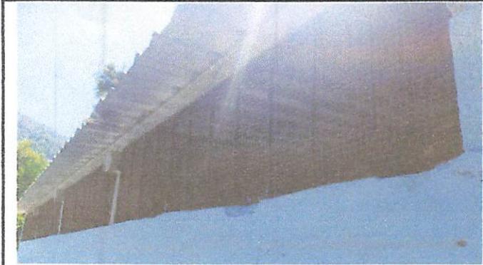
Foto7: suministro, fabricación e instalación ventanas de metal más vidrio transparente de 3mm con medida de 1.46m x 40m para área de cocina