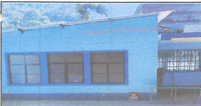
Foto 11: Instalación de depósito de agua Rotoplast de 1100l y accesorios.