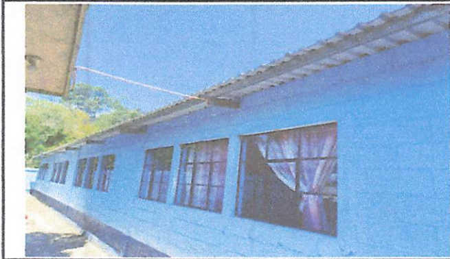
Foto1: Suministro e instalación de 27 metros de canal de metal calibre 26" con soporte y bajadas de agua