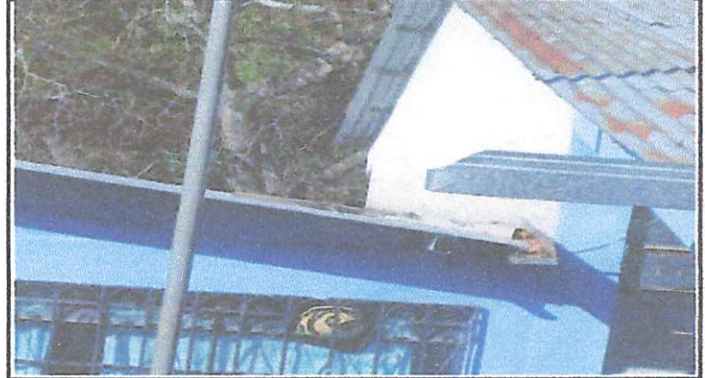
Foto 2: Suministro e instalación de 7 metros de canal de metal calibre 26" con soporte y bajadas de agua