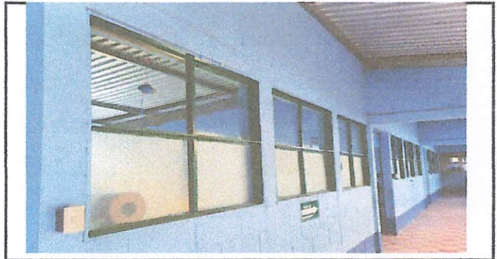
Foto 6: suministro, fabricación e instalación de ventanas de metal con vidrio transparente de 5mm con medidas de 1.35m x 1.13m para sustitución de ventanas de madera en salones

Observación: Si es necesario se pueden agregar hojas adicionales y actualizar el número de hojas.