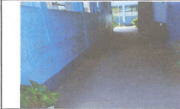
Foto 13: Sustitución de piso de torta de concreto x piso cerámico antideslizante