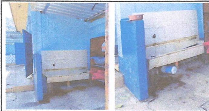
Foto 5: SERVICIOS SANITARIOS Y ACCESORIO (Remodelación de Mingitorios)