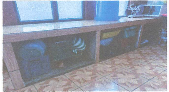
Foto 14: Suministro, fabricación e instalación de puertas de metal de dos bandas para gabinete de concreto en cocina