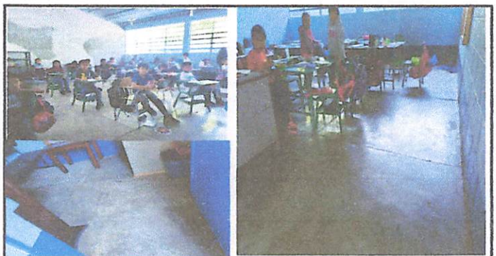
Foto 12: Sustitución de piso de cemento liquido x piso cerámico antideslizante

Observación: Si es necesario se pueden agregar hojas adicionales y actualizar el número de hojas.