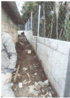
Muro perimetral terminado de la parte posterior