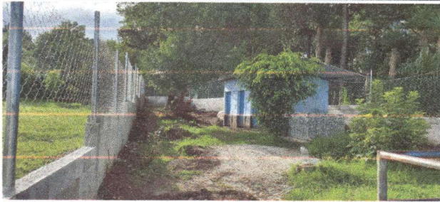
Muro perimetral terminado de la parte frontal.