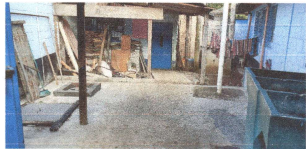
Losa de semento ya culminada en la parte posterior de las aulas del edificio central.

Observación: Si es necesario se pueden agregar hojas adicionales y actualizar el número de hojas.