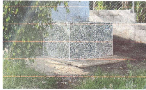
Pila terminada con recubierta de piso cerámico,