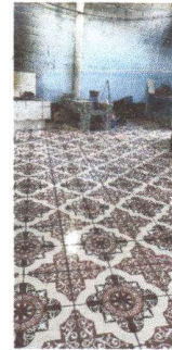
Piso cerámico colocado en toda el área de la cocina