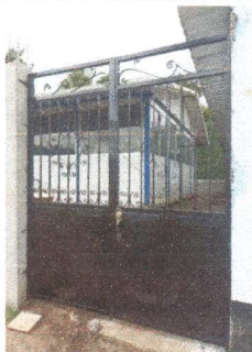
Portón ya instalado para el acceso al aula lateral del edificio central.