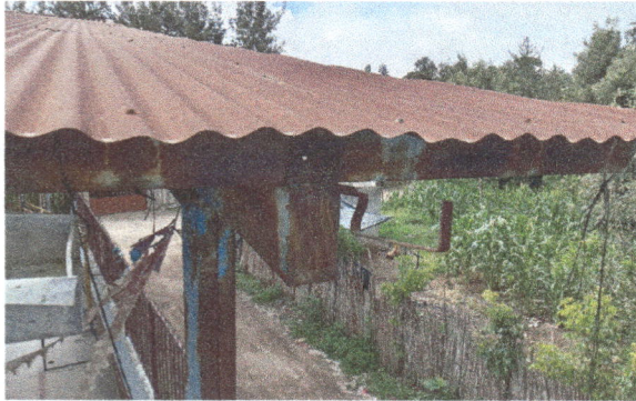
Foto1: Se desinstalará la lámina oxidada y se instalará lámina troquelada, también se limiará y se pintará la estructura