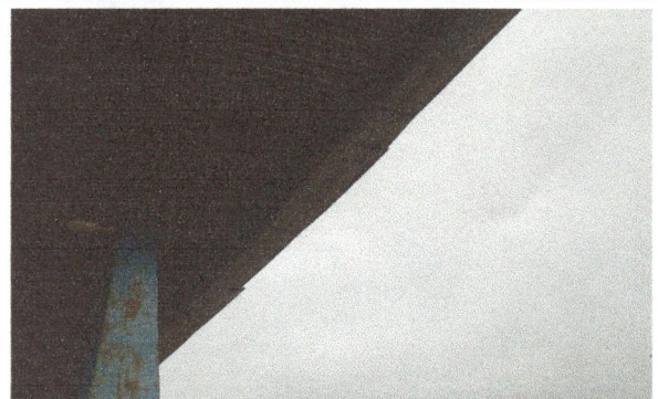
Foto 4: Se cambiarán las canaletas de un ala ya que tiene muchos desperfectos.