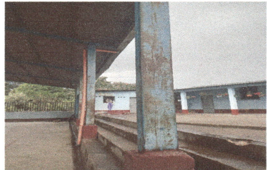
Foto 6: Se deslaminará y se enlaminará el techado de la cancha en su totalidad.

Observación: Si es necesario se pueden agregar hojas adicionales y actualizar el número de hojas.