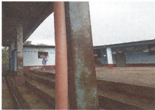
Foto 5: Se lijarán y se pintarán con material intercorrosivo toda la estructura metálica del techo de la cancha. Porque tiene mas de 20 años sin intervención