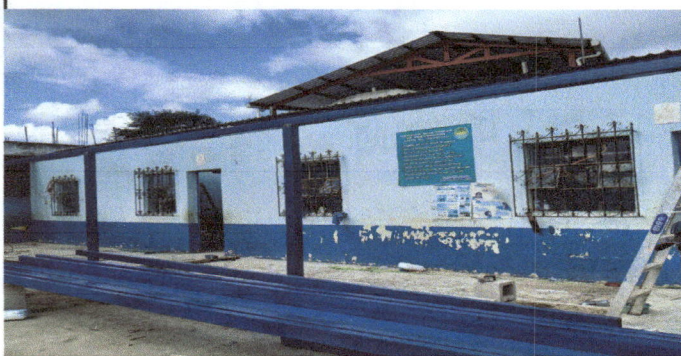
Foto 3: Modulo 1 Cambio de techado de dos salones area de referencia dirección, y mantenimiento delas costaneras con pintura