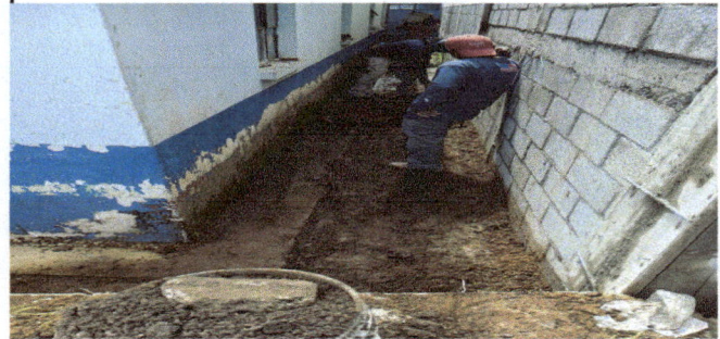
Foto 2: Mejoramiento de cuneta de Cuneta exterior y muro de block