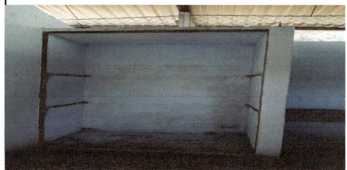
Foto 6: Remodelación de trinchante de alimentos se fundirá tres espacios de concreto y se cambiara la puerta por una de metal de dos bandas con chapa yale.

Observación: Si es necesario se pueden agregar hojas adicionales y actualizar el número de hojas.