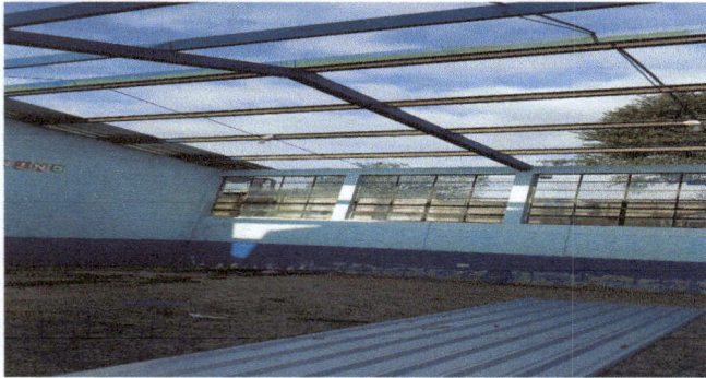
Foto1: Modulo 2 Cambio de techado completo de 2 salones que se encuentra en la entrada del lado izquierdo de la escuela, cambio de parales y colocación de lineales de canales enfrente y atrás de los salones.