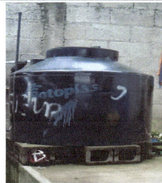
Foto 4: Cambio de tinaco pequeño por otro mas grande ya que no se da abasto para la distribución de agua.