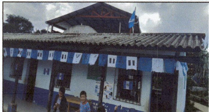
Foto1: Modulo 2 Cambio de techado completo de 2 salones que se encuentra en la entrada del lado izquierdo de la escuela, cambio de parales y colocación de lineales de canales enfrente y atrás de los salones.