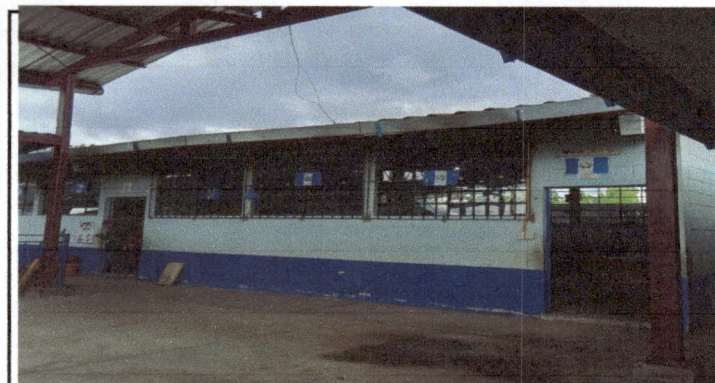
Foto 3: Modulo 1 Cambio de techado de dos salones area de referencia dirección, y mantenimiento delas costaneras con pintura