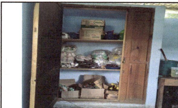
Foto 6: Remodelación de trinchante de alimentos se fundirá tres espacios de concreto y se cambiara la puerta por una de metal de dos bandas con chapa yale.

Observación: Si es necesario se pueden agregar hojas adicionales y actualizar el número de hojas.