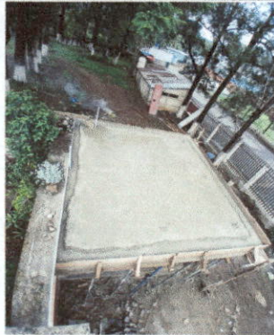
Foto 1: Levantado de 4 paredes para laboratorio de purificadora de agua