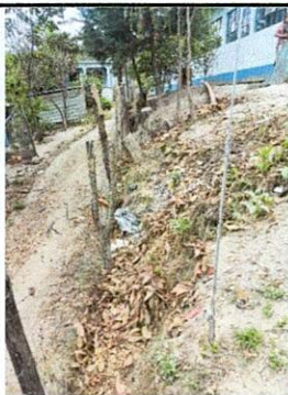
Foto 5: Area perimetral del lado norte colindante con una calle en donde la inclinación por el lavado de la tierra cada vez se hace mas grande limitando el espacio util de la escuela.