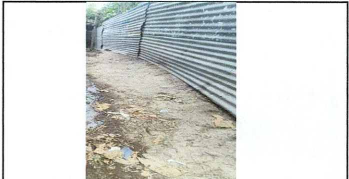
Foto 6: Lado perimetral este de la escuela que separa unicamente por una pared de laminas improvisado la escuela de un terreno particular, no siendo lo adecuado debido a posibles cortes con los filos salientes de la

Observación: Si es necesario se pueden agregar hojas adicionales y actualizar el número de hojas.