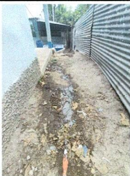
Foto 3: Salida de agua de la cocina, que se encuentra dentro de la escuela a un costado de la cocina, que desemboca a una calle al costado de la escuela, provocando el deterioro de la misma.