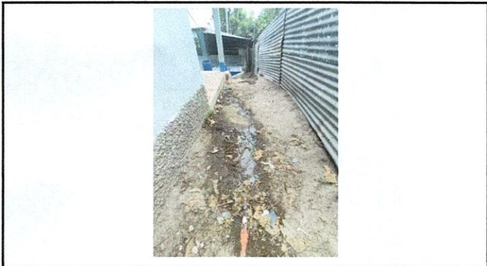
Foto 3: Salida de agua de la cocina, que se encuentra dentro de la escuela a un costado de la cocina, que desemboca a una calle al costado de la escuela, provocando el deterioro de la misma.