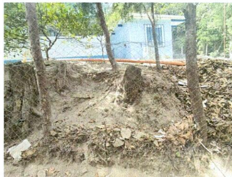
Foto 2: Area perimetral en constante desbordamiento redeado unicamente por postes y malla, restando espacio util de recreación para los niños.