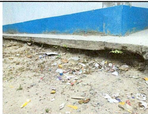
Foto 4: Por falta de cunetas, se ha ido lavando la tierra lo que provoca fisuras en banqueta y pared.