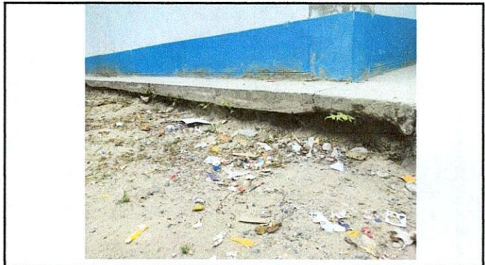
Foto 4: Por falta de cunetas, se ha ido lavando la tierra lo que provoca fisuras en banqueta y pared.