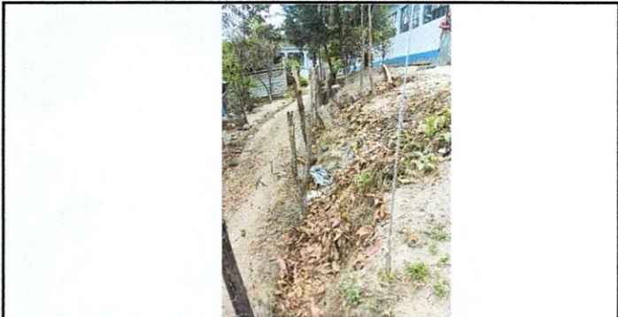
Foto 5: Área perimetral del lado norte colindante con una calle en donde la inclinación por el lavado de la tierra cada vez se hace mas grande limitando el espacio util de la escuela.