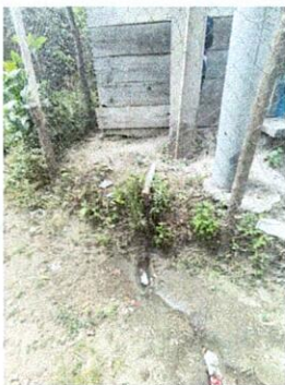
Foto 1: Salida de agua de la pila a la calle de un costado de la escuela sin un canal de agua adecuado lo que deteriora la calle constantemente.