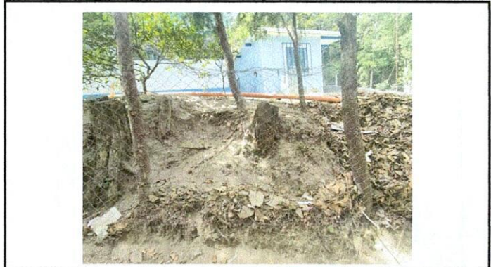
Foto 2: Área perimetral en constante desbordamiento redeado unicamente por postes y malla, restando espacio util de recreación para los niños.