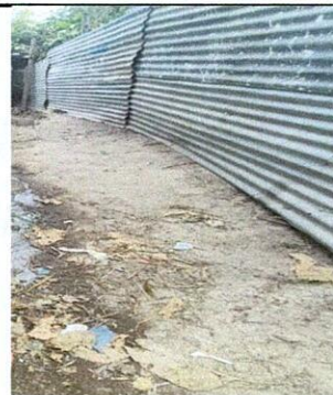
Foto 6: Lado perimetral este de la escuela que separa unicamente por una pared de laminas improvisado la escuela de un terreno particular, no siendo lo adecuado debido a posibles cortes con los filos salientes de la

Observación: Si es necesario se pueden agregar hojas adicionales y actualizar el número de hojas.