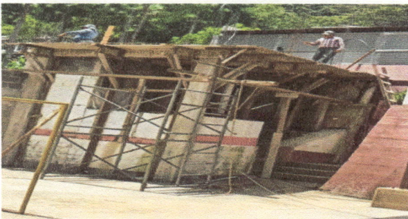
Foto 5: Se foramió y fundió la loza que sostendrá el finaco que captará el agua para los sanitarios