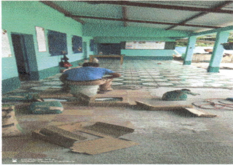
Foto 1: Se cambió y corrigió el piso para colocar piso cerámico en todas las aulas y corredor del establecimiento educativo.