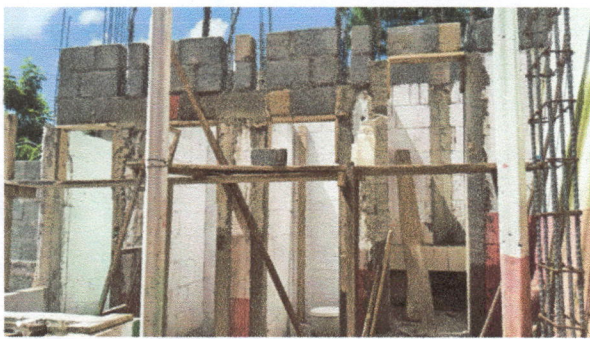
Foto 3: Se reforzaron las paredes de los sanitarios y se subieron hasta la loza para que sea de mejor garantía