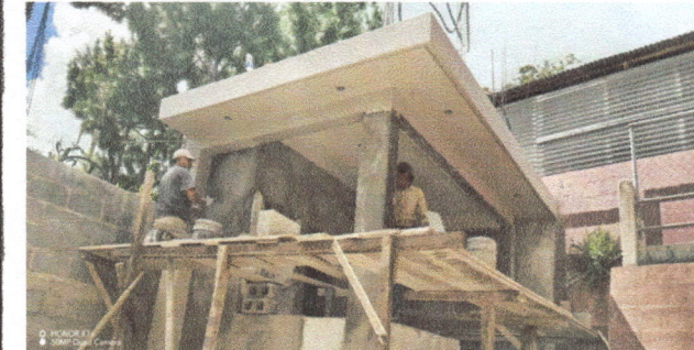
Foto 6: Después de sacar la madera que sostenía la loza se inició con los trabajos de acabados

Observación: Si es necesario se pueden agregar hojas adicionales y actualizar el número de hojas.