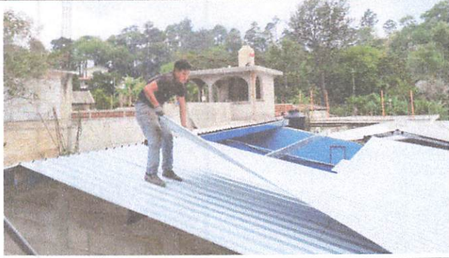
Foto1: Techo de lámina de aula No. 5