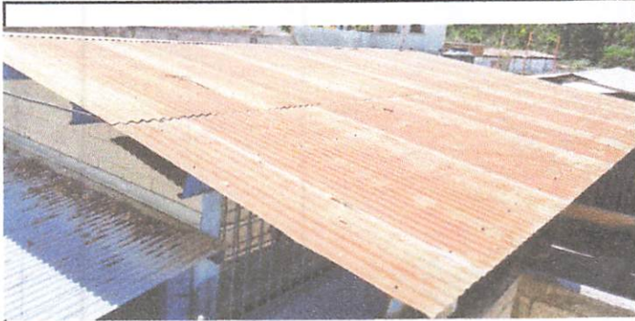
Foto1: Techo de lámina de aula No. 5