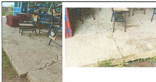
sustitución de torta de cemento del corredor de las aulas.