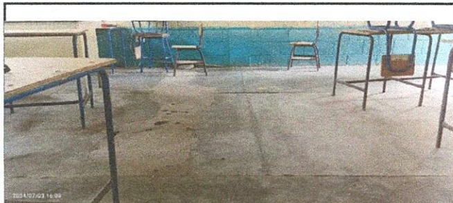
Instalación de piso Ceramico en los salones de clases