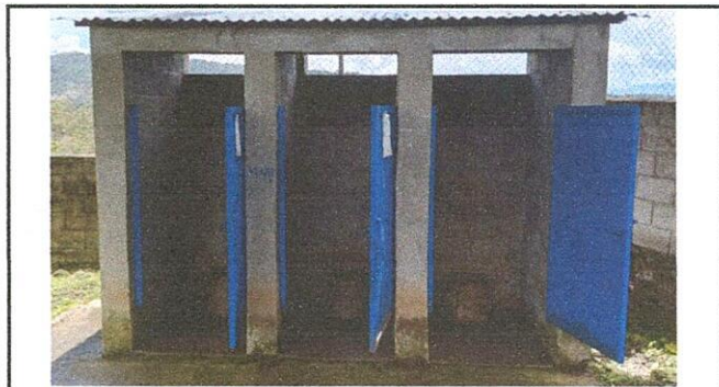
Sustitución de letrinas por sanitarios lavables