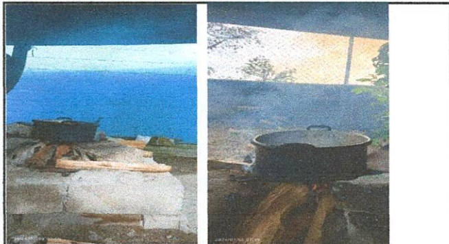
Ampliación, remodelación, sustitución de torta de cemento y sustitución de estufa rural mejorada