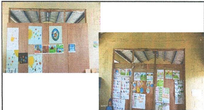
Fabricación e instalación de persiana