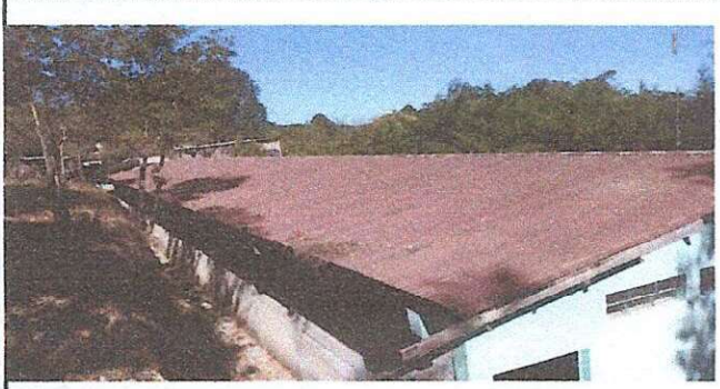
Foto1: cambio de lamina ondulada por lamina troquelada.