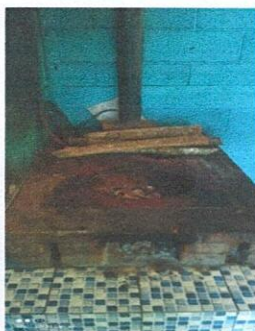
Foto 5: Cocina: Suministro e instalación de 2 estufas rural. (completa) incluye chimenea y plancha de metal.