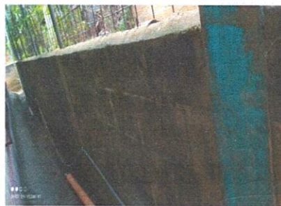
Foto 6: Cunetas de concreto: suministro de fundición de cunetas de concreto con regillas

Observación: Si es necesario se pueden agregar hojas adicionales y actualizar el número de hojas.