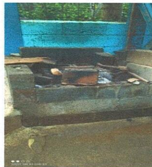
Foto 4: Cocina: Suministro e instalación de 2 estufas rural. (completa) incluye chimenea y plancha de metal.