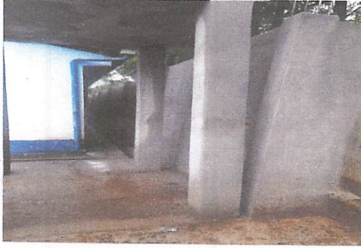
Foto1: trabajo terminado de muro