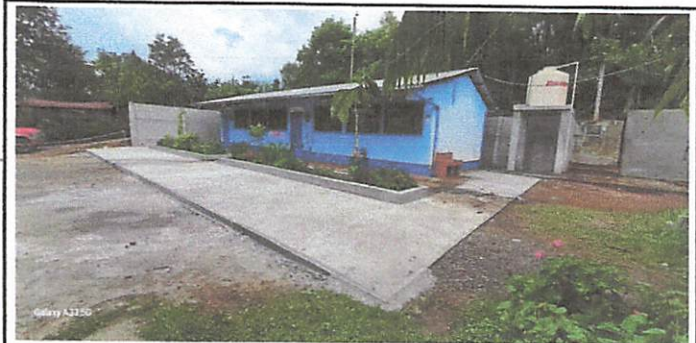
Foto 6: Terminación del trabajo del proyecto mantenimiento de edificios escolares publicos

Observación: Si es necesario se pueden agregar hojas adicionales y actualizar el número de hojas.