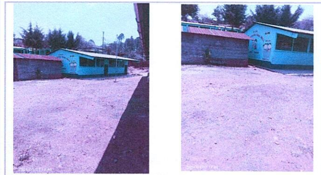
Foto 3: SUSTITUCION DE PATIO EN ADOQUINADO E INSTALACION DE DRENAJE DE AGUA PLUVIAL.