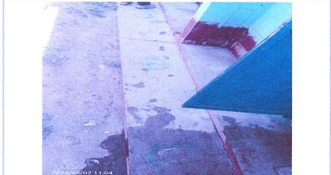
Foto 2: PASILLO ANGOSTO, AMPLIAR PASILLO PARA UNA BUENA CIRCULACION DE LOS NIÑOS EN CUANTO AL USO DEL SERVICIO SANITARIO.