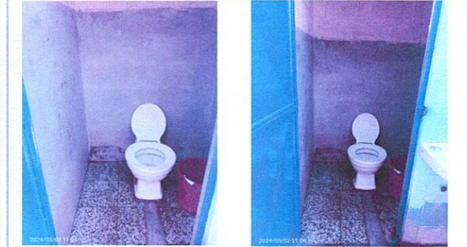
Foto1: SERVICIO SANITARIOS CON NESESIDADES: INSTALACION DE PISO ANTIDESLIZANTE, AZULEJO EN MUROS, CAMBIO DE INHODORO.