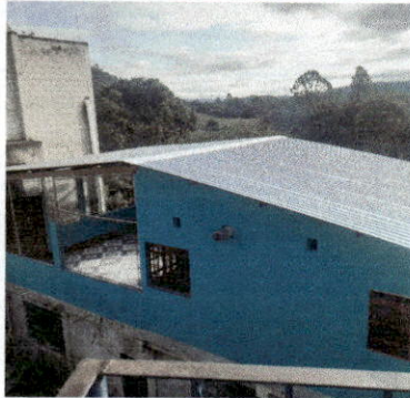
Foto 1: ESTRUCTURA DE METAL + CAMBIO DE LAMINA POR LAMINA TROQUELADA CALIBRE 26 ALUZINC.