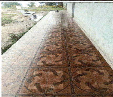
Foto 3: SUSTITUCIÓN DE PISO POR PISO CERAMICO, CORREDOR DE AULAS.