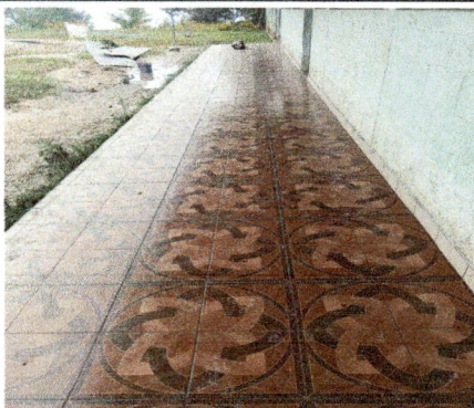
Foto 3: SUSTITUCIÓN DE PISO POR PISO CERAMICO, CORREDOR DE AULAS.