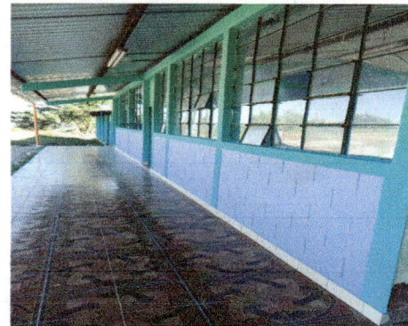
Foto 4: APLICACIÓN DE PINTURA EN PADERES, DE AULAS Y DIRECCIÓN; INTERIORES Y EXTERIORES