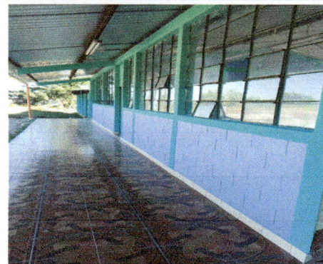
Foto 4: APLICACIÓN DE PINTURA EN PADERES, DE AULAS Y DIRECCIÓN; INTERIORES Y EXTERIORES